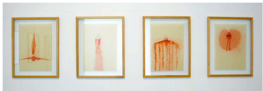
Extraits de la série « Muette », encre aquarelle sur papier japon

La petite figure solitaire qui est représentée est peinte en rouge sur un papier japon dont la finesse est rendue évidente par son principe d'encadrement : le papier, prisonnier entre deux plaques de verre, laisse deviner en transparence la présence du mur. À la légèreté de la figure fluette qui vole ou flotte au milieu du format correspond donc la fragilité matérielle du support. Pourtant une violence évidente émane de l'ensemble de la série. Bien sûr, elle est exprimée par la manière dont la figure se perd, se noie, se dilue, se dissout dans le papier. Mais ce qui en fait l'expression d'une souffrance est la façon dont l'encre malmène le papier qui s'est rétracté au contact de l'eau et qui par endroits a fini par se percer.