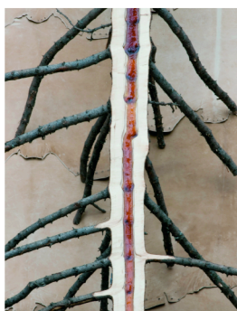
Giuseppe Penone, Matrice de linfa , Beaux-Arts de Paris, 2009, sapin, résine végétale, terre cuite, cuir, métal 127x4367x212 cm.