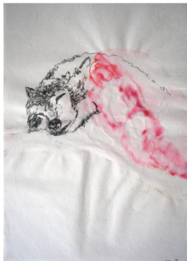
Extraits de la série « Figure/loup », encre aquarelle et mine de plomb sur papier japon

Cette dernière série montre un loup dessiné à la mine de plomb en présence d'une figure transparente peinte à l'aquarelle rouge. La précision du dessin du loup s'oppose à la silhouette floue du personnage comme le noir et blanc s'oppose à la couleur. La cohabitation des techniques différentes attribuées à chacune des deux figures accentue l'antagonisme entre l'homme et l'animal et exacerbe les relations qui semblent se jouer entre eux dans l'espace clos et intime du format. Comme dans cette performance de Joseph Beuys ( I like America and America likes me , 1974) au cours de laquelle l'artiste s'enferme trois jours dans une cellule avec un chacal, ces deux-là, si différents, sont-ils sur le point de s'appivoiser ou leurs attitudes complices ne sont-elles qu'un leurre, une illusion, un désir du spectateur ?