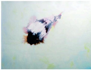
Sans titre, 2006, encre aquarelle sur papier, 140 x 87 cm.